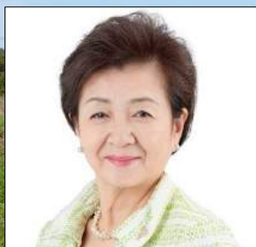
嘉田由紀子 参議院議員 前滋賀県知事