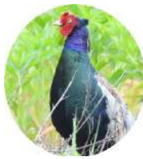
上流地区に生息中のキジ